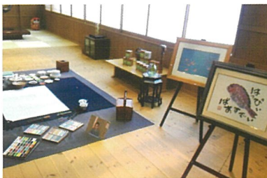
館内にあるアトリエ